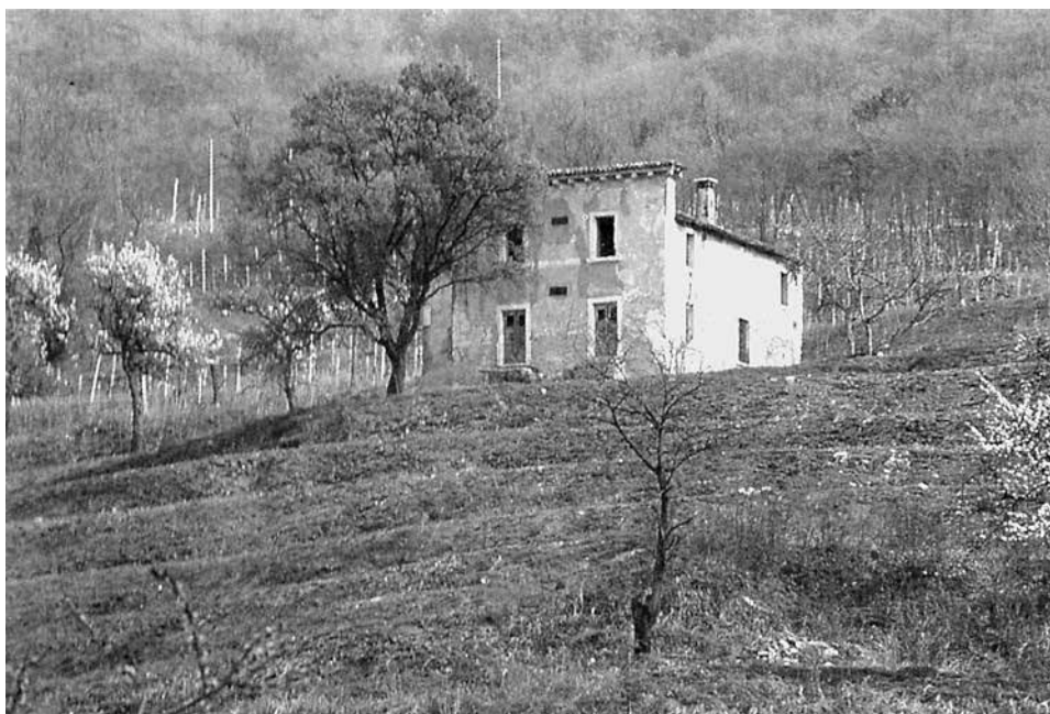
L'antica chiesa comunitaria di Ognissanti, di cui rimane ancora l'abside, trasformata dai Mosconi in casa da lavorenzia.