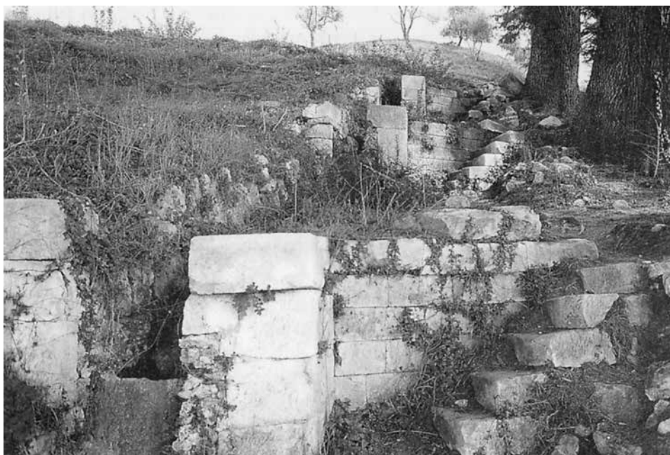
Il belvedere di Ognissanti con la fontana voluta dai Mosconi nel quadro di una visione bucolica della vita in villa.