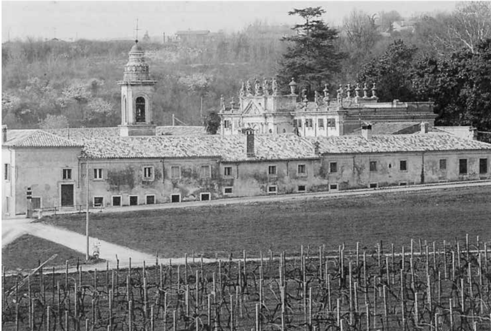
Immersa nel verde circostante la villa si affaccia direttamente sulle tenute agricole.

rispetto al muro di cinta, uno dei quali tuttora, almeno parzialmente, conservato. Nelle immediate adiacenze vi erano i relativi orto e brolo; più distante, sul monte di Ognissanti, un secondo insediamento casalivo con cortivo ove risiedevano i lavorenti. Con l'atto Fabriani entrava in possesso anche dei relativi diritti d'acque e delle attrezzature aziendali (33) . Il prezzo d'acquisto, 12.500 ducati, è decisamente rilevante se si considera che i da Marano sono indotti alla vendita, com'è espressamente scritto nell'atto, dalla scarsissima rendita che la possessione è in grado di assicurare e dalle ingenti spese causate dalla necessità di difesa dalle alluvioni (34) .